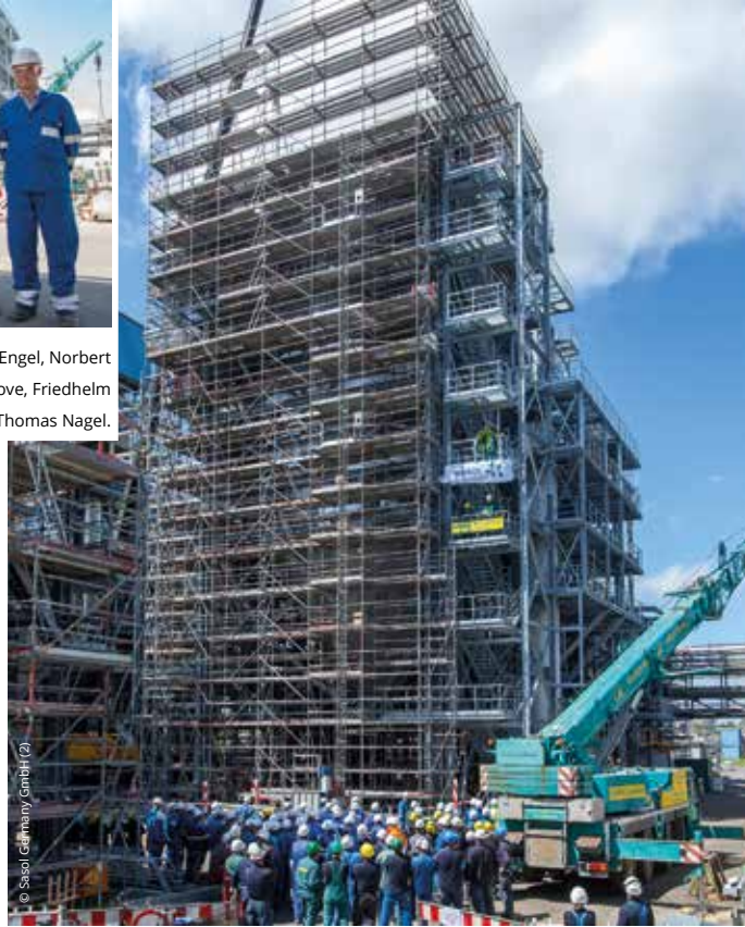
Festakt in Brunsbüttel: Die Baustelle des neuen Sprühtrockners mit Richtkranz.